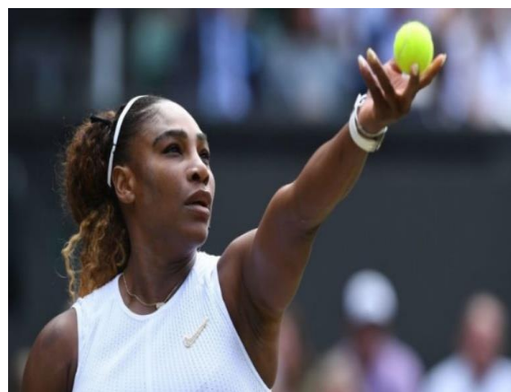
Serena Williams ao sacar

Serena é ativista de várias iniciativas junto às comunidades negras e apoia o movimento Black Lives Matter .