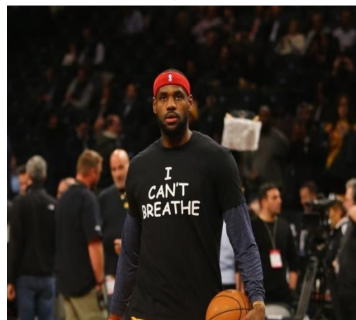
LeBron James com camisa escrito “Não posso respirar.”

Veja na foto abaixo que o jogador vestiu uma camisa com a mensagem “Não consigo respirar”, frase repetida por George Floyd enquanto era assassinado pelo policial nos Estados Unidos.