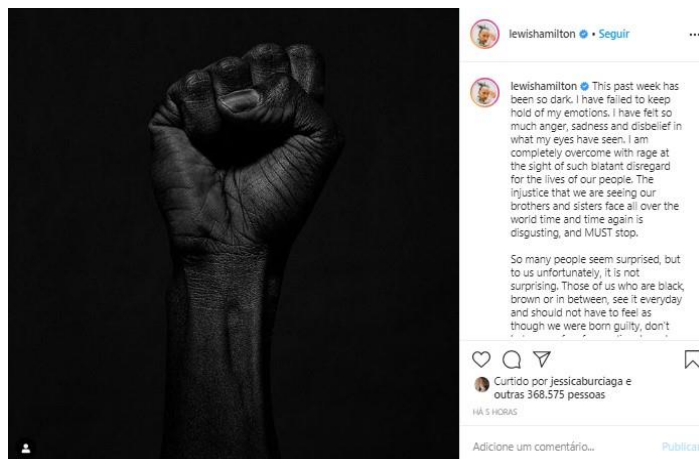
Post de Lewis Hamilton contra racismo

O inglês já sofreu alguns casos de racismo durante a carreira e questiona a diferença de tratamento dada pela imprensa britânica a ele e a outros pilotos conterrâneos. Hamilton também já criticou várias vezes a falta de diversidade no grid da F1. Após a morte de George Floyd, foi às redes sociais cobrar um maior posicionamento dos outros pilotos nas questões raciais, visto que era o único que tinha se manifestado sobre a violência policial. “A injustiça que vemos com nossos irmãos e irmãs de todo o mundo, o tempo todo, é desprezível e precisa parar”, diz ele.