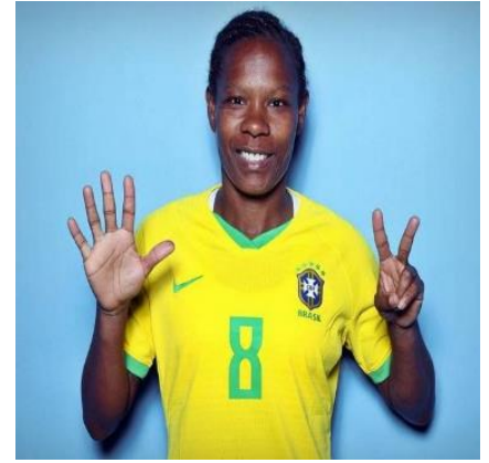
Formiga faz símbolo de 7 com as mãos

Atualmente atleta do PSG, na França, Formiga deu uma entrevista ao Portal Notícia Preta, em 2019, em que afirmou: “Sempre quando posso tenho conversas com as meninas, principalmente no Brasil, em relação ao racismo. Só o fato de ser negra e nordestina (Bahia) já se sofre um preconceito muito grande, com certeza. E, sem dúvida, tratando-se de mulher e negra em qualquer área de trabalho há olhares tortos. Vejo poucas mulheres, poucos técnicos também negros no comando, é um absurdo. Eu condeno totalmente pessoas que agem desta forma”, disse ela.