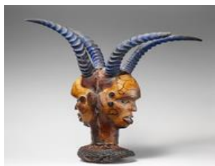
MÁSCARA DE DUAS FACES- POVO ETOI

Muitas são as contribuições das máscaras africanas na atualidade, pois elas retratam significados que expressam sentimentos, os quais vivenciamos no nosso dia a dia. A máscara é um objeto de mil e um significados e será que nossos pensamentos e sentimentos também flutuam entre tantas emoções e expressões? Muitas vezes temos que usar máscaras no nosso cotidiano quando temos que viver várias emoções. Os homens - com suas necessidades compulsórias de dissimulação, isto é, de desconstruir o rosto que têm e de compor um outro de acordo com sentimentos que quase nunca conseguem expressar - quando mascarados sentem-se mais a vontade. Podem inclusive, visitar um amigo em desgraça sem a necessidade de fingir, com a própria fisionomia, uma dor que não sentem. Também podem vivenciar sentimentos de raiva por dentro e por fora expressarem felicidade e alegrias. Enfim, tantas outras situações. Máscaras e expressões que constituem a cultura africana e que vivenciamos em muitos momentos da nossa existência.