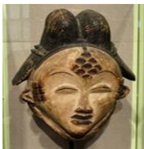
MÁSCARA POVO PUNU