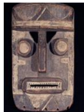
MÁSCARA RAIVOSA - POVO GREBO